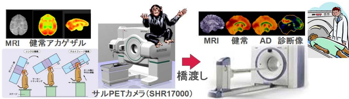
図 1. FDG-PET 試験による脳画像評価