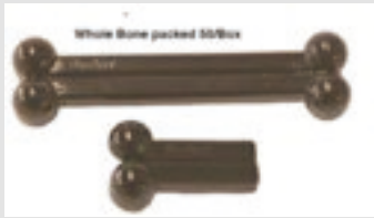
Bio-Serv Nylon Bone