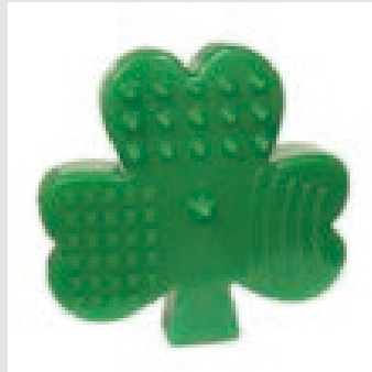
Lucky Clover Chew