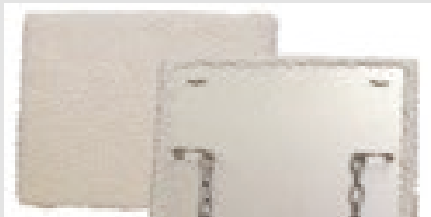
Fleece Grooming Board

はケージ内にエンリッチメントデバイスを用意するなどの工夫が必要です。マウスには齧る、のぼる、隠れるが可能なアイテムを、サルにはモンキーシャインミラー、コングや毛繕いが出来るグルーミングボードがあれば少しは気がまぎれるかも知れません。ご存じの通りグループ飼育は不仲な相手は避けるべきです。また、途中で不仲になってしまうケースもあり観察は欠かせません。下記はグループハウジングが出来ないときなどに使用するサル用 Fleece Grooming Board です。