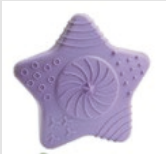
Dental Star, Purple