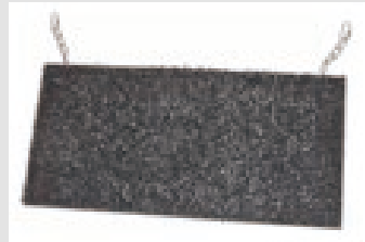
Ultimate Turf Swine Scratcher