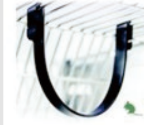
Mouse Swing, Single