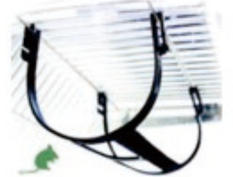
Mouse Swing, Double