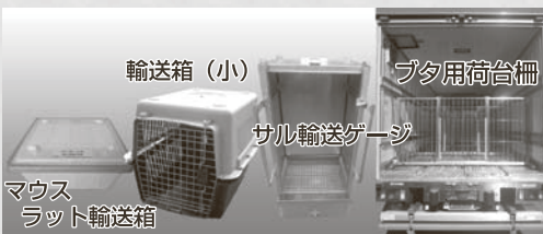
マウス ラット輸送箱

積載室の温度管理や虫を防ぐためのカーテン、大気中の砂・ほこり・カビ・菌等の不純物を防ぐためのフィルタ、積載室の動物（遺伝子改変動物）の逃亡防止のためにネズミ返しの設置をしています。