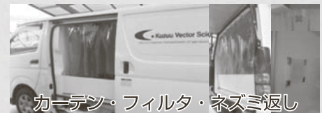
カーテン・フィルタ・ネズミ返し

積載室の温度管理や虫を防ぐためのカーテン、大気中の砂・ほこり・カビ・菌等の不純物を防ぐためのフィルタ、積載室の動物（遺伝子改変動物）の逃亡防止のためにネズミ返しの設置をしています。